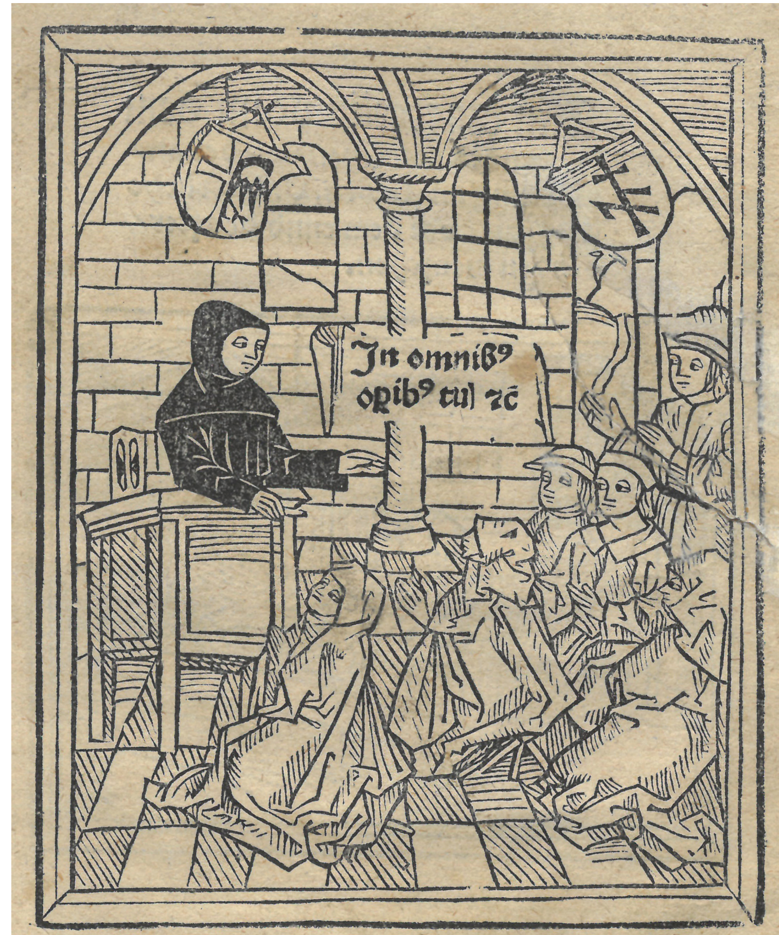
Holzchnitt aus dem Traktätlein von dem sterbenden Menschen von der Anfechtung im Sterben, gedruckt von Albrecht Kunne in Memminger nicht vor 1497

Gebunden wurden die Drucke in Memminger, Augsburg, Köln, Ulm, Leipzig und neunzehn weiteren Buchbindereien. Ein Schwerpunkt der Sammlung liegt in den Werken des Memminger Buchdruckers Albrecht Kunne (ca. 1474 bis 1520?). 166 Bücher haben sich erhalten, davon 50 Inkunabeln.