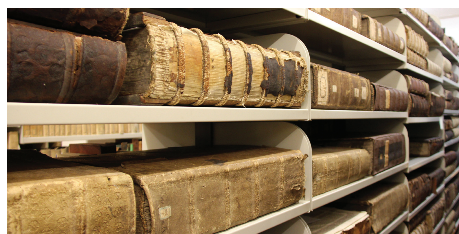
Inkunabeln liegend im Grimmelhaus