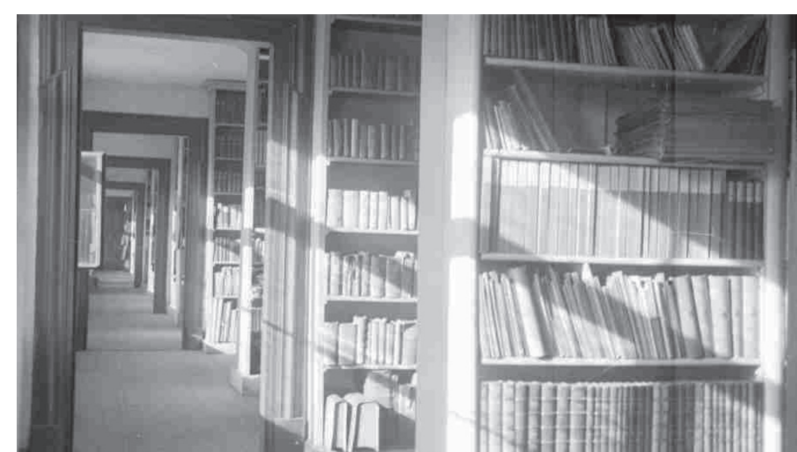
Bibliotheksraum im Steuerhaus, spätes 19. Jahrhundert

Stadtarchiv Memmingen Ulmer Straße 19 87700 Memmingen stadtarchiv@memmingen.de 08331 850143